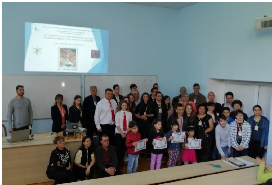
Наградените деца заедно с участници в конференцията.