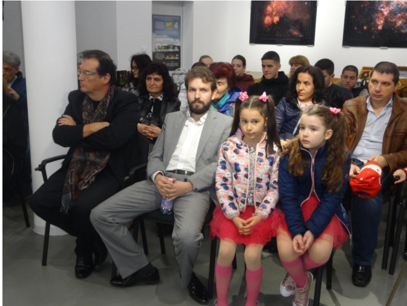
Залата затаи дъх при изпълнението на космическата песен "Излел е Делю хайдутин"